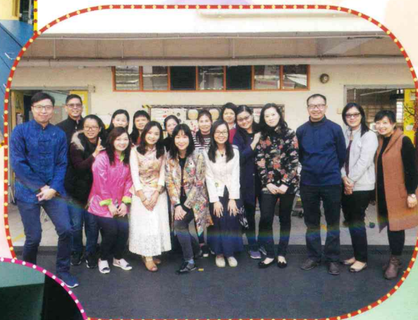
關懷月啟動禮 暨 關懷送暖華服日