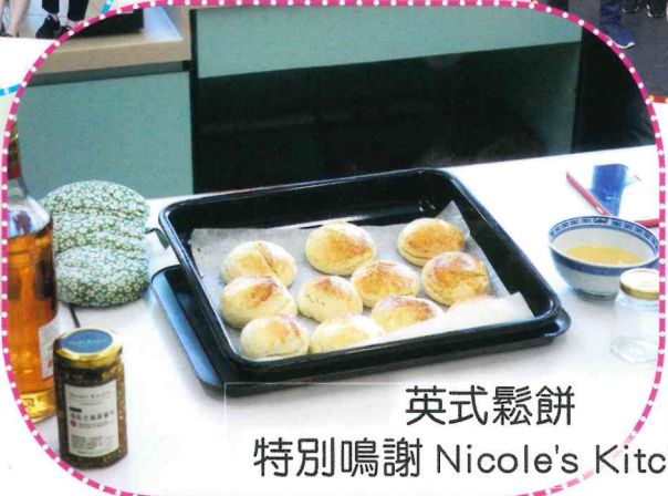
英式鬆餅 特別鳴謝 Nicole's Kitchen