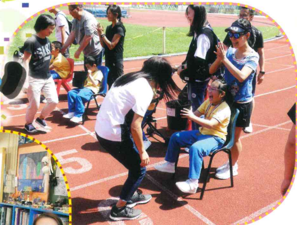
本年度運動會 (親子接力比賽)