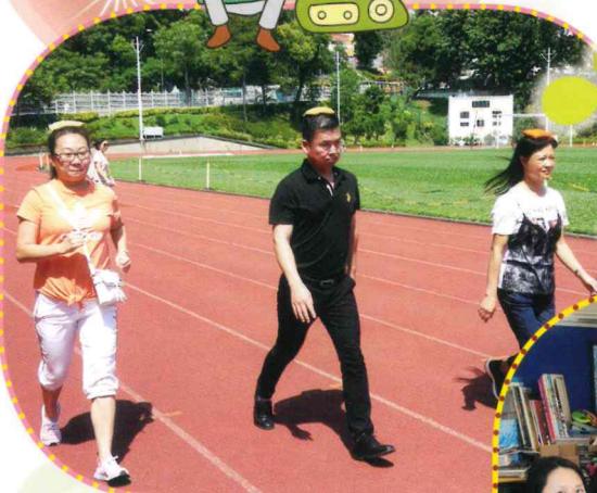
本年度運動會 (親子接力比賽)