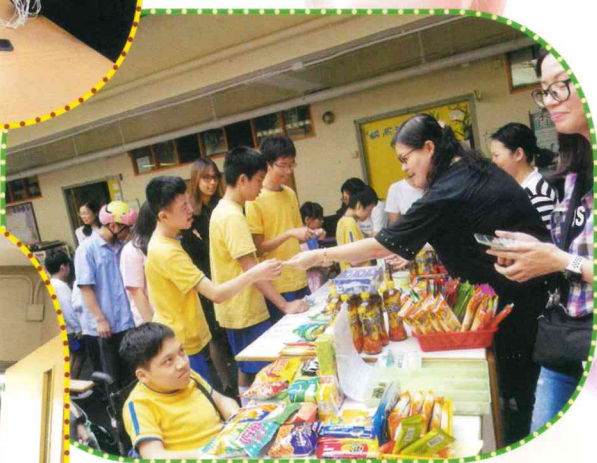
當日小賣部熱鬧情況