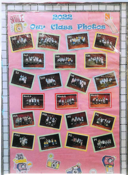
21-22 年度之「我們的班相」