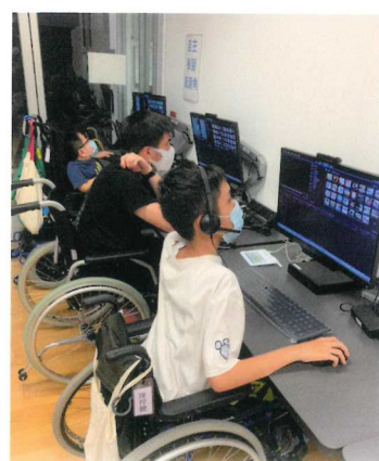
學習進行音樂剪片