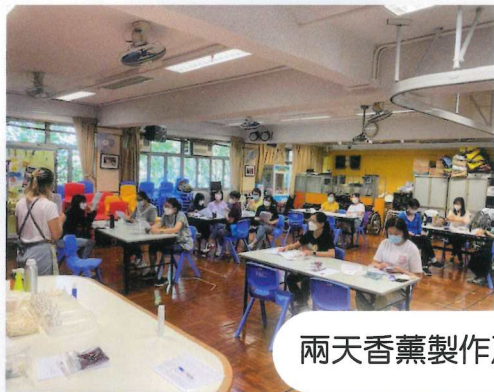
兩天香薰製作及按摩手法工作坊