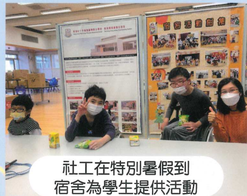
社工在特別暑假到宿舍為學生提供活動