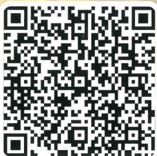
成為 PTA 會員 聯屬會員的 QR Code