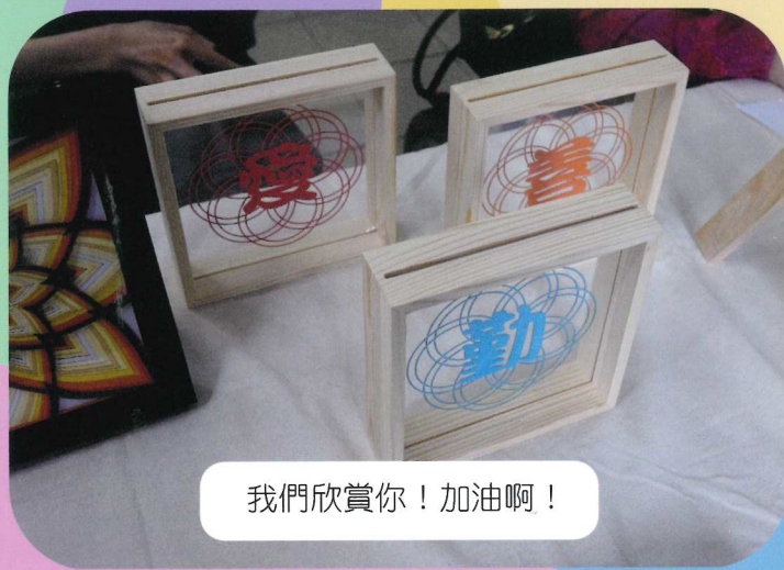
我們欣賞你！加油啊！