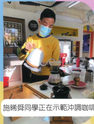
施晞舜同學正在示範沖調咖啡