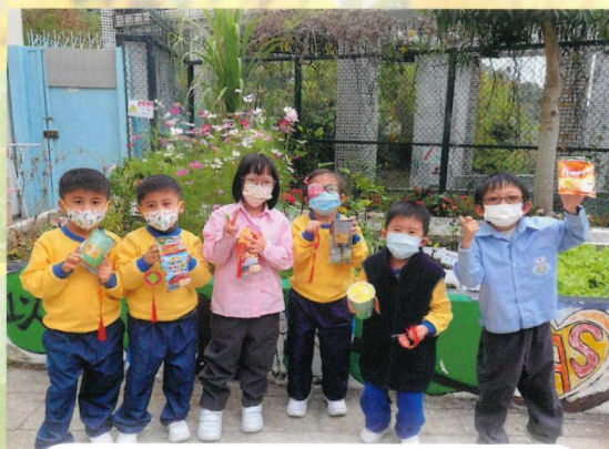
小一學生興高采烈地接過賀年福袋